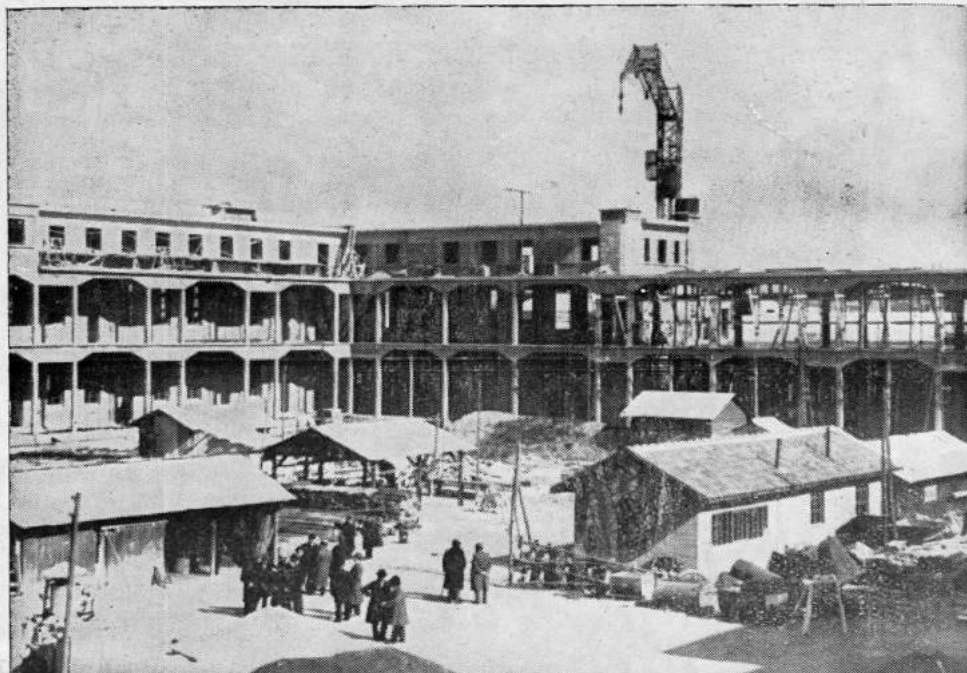
Une vue du Chantier