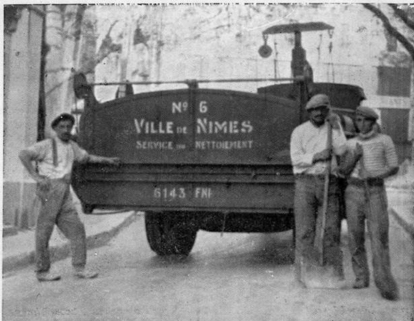
des Chevaux-Vapeur, des Camions fermés, hygiéniques.

Document extrait de l'édition originale du Bulletin Municipal de 1935.