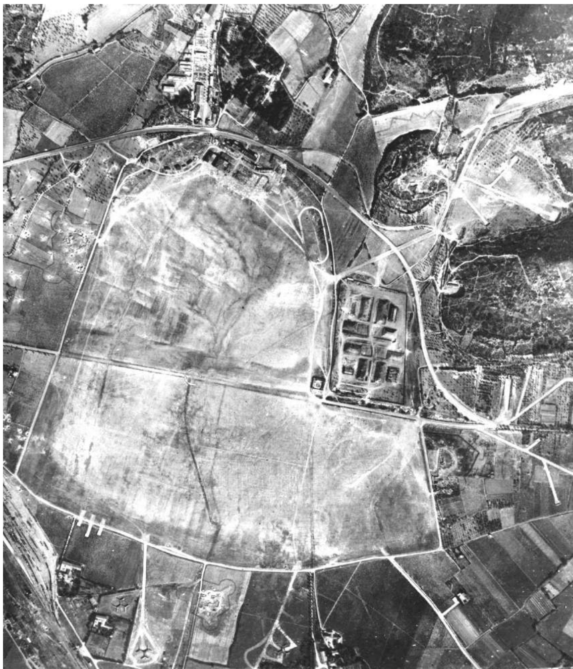
Photo aérienne, du terrain d'aviation de Courbessac, prise le 25 août 1944 par l'aviation américaine.

On repère la moitié du terrain sud, au bas de la photo rajoutée sous la municipalité d'Hubert Rouger.