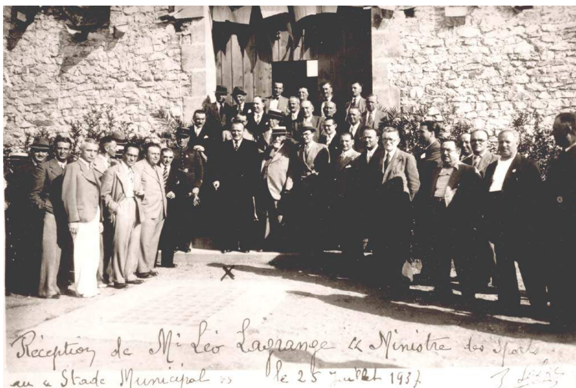
Réception par M. le Maire de Nîmes Hubert Rouger, du Ministre des Sports, M. Léo Lagrange, au nouveau Parc Municipal des Sports de Saint Césaire le 25 juillet 1937.

Le district a reconnu les terrains du Parc Municipal des Sports comme appartenant indivisément en quelque sorte aux sociétés locales qui bénéficient d'un terrain officiel. Nos clubs locaux, véritables pépinières pour la formation de joueurs de grande classe, sont désormais autorisés à s'engager en championnats, les visiteurs pouvant être reçus sur notre stade Municipal.