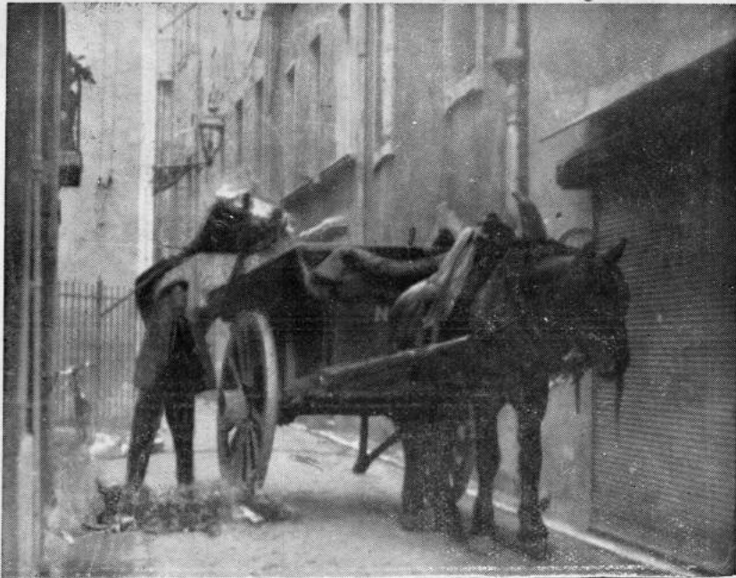
La vieille haridelle, l'antique tombereau, sont avantageusement remplacés par.....