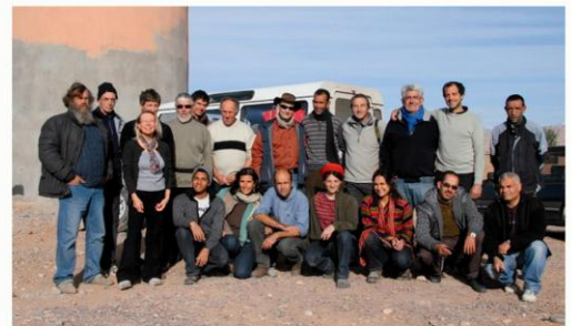
Bergers de l'Aigoual au maroc