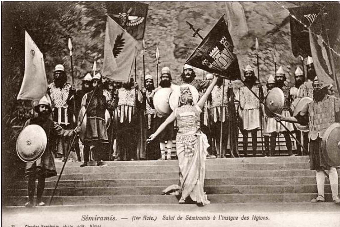
Sémiramis. — (1 er Acte.) Salut de Sémiramis à l'insigne des légions.

Et après la scène sanglante où devant l'armée impassible à la voix de leur souveraine, leur chef a immolé le rival des légions et où la reine a vengé son amant, quand tout semble s'écrouler, le mage n'a qu'un mot : « La gloire est sauvée ! », Sémiramis n'est pas tombée devant le peuple consterné et l'armée révoltée ; avant que le poison ait fait son oeuvre, le mage et le prêtre ont préparé la scène finale.