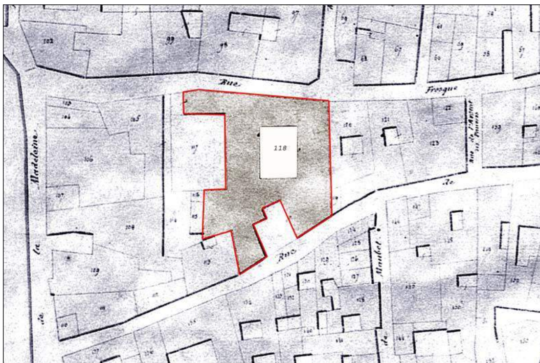
L'Hôtel Novi de Caveirac, cadastre de 1829